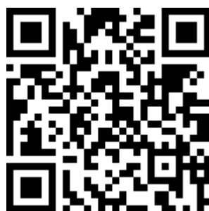
QR -код «Презентация с мастер класса»