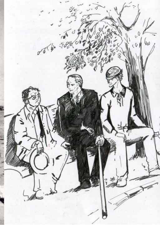
В. «Гранатовый браслет»