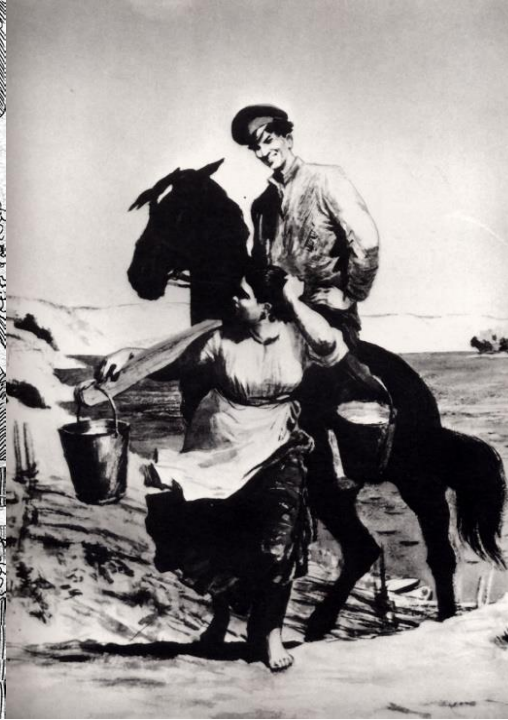
Б. «Анна Снегина»