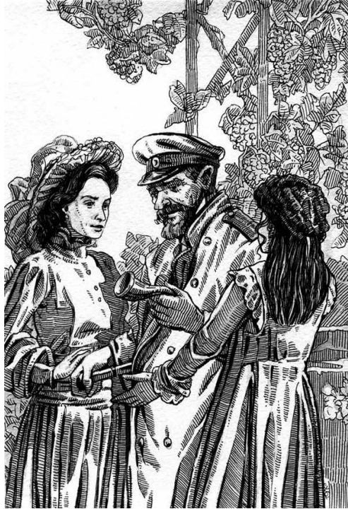
А. «Тихий Дон»