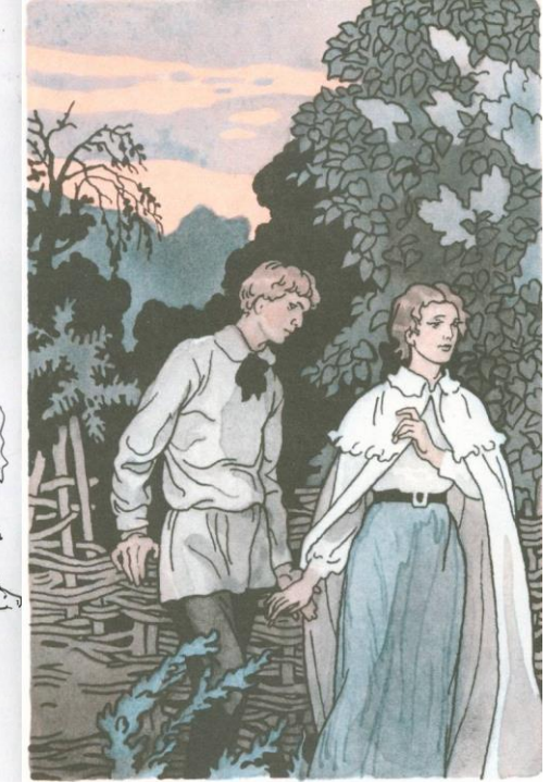
Г. «Мастер и Маргарита»