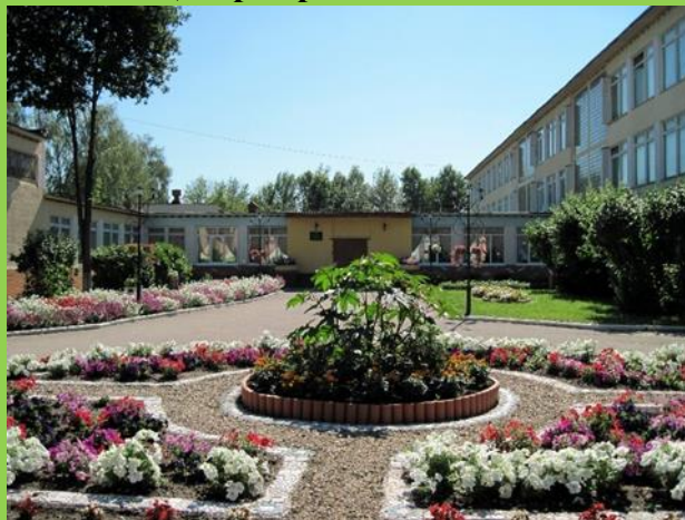
Здание № 3

Муниципальное бюджетное общеобразовательное учреждение «Центр образования № 33»