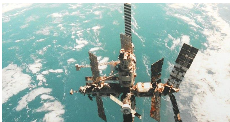
Станция «Мир» до того, как упасть

была затоплена в Тихом океане в начале тысячелетия. Очень смахивает на Титаник. На океаническом дне лежит МАШИНА весом примерно 106 000 тон!