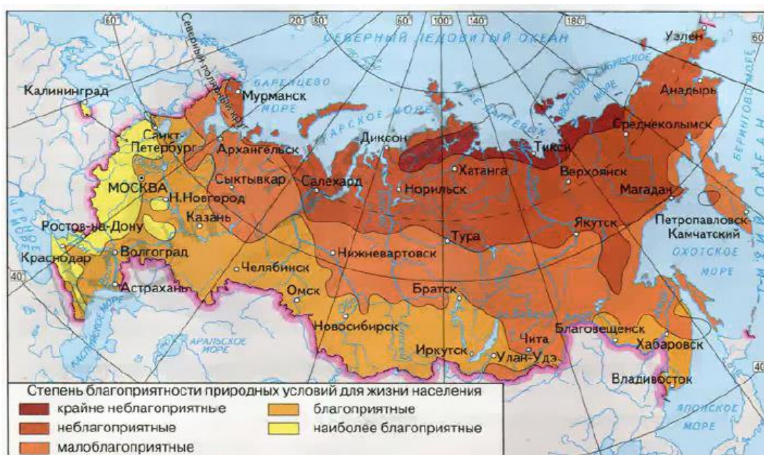
Рис. 1. Степень благоприятности природных условий для жизни населения в России

При сильном ветре холодная погода, как это наблюдается в северных районах, кажется ещё холоднее. Прохладный ветер в летний зной смягчает жару.