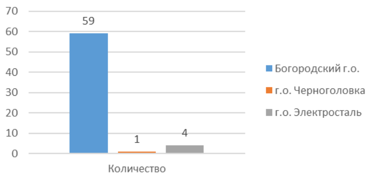
«Развитие осознанности чтения как средства интеллектуального развития младших школьников во внеурочной деятельности и в рамках дополнительного образования»

Приняли участие - 64 человека, из 3 городских округов.